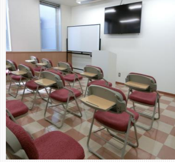
교실 ※ 개조 중