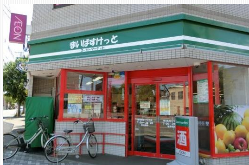
近隣スーパー(徒歩1分)