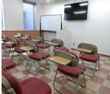
교실 ※ 개조 중