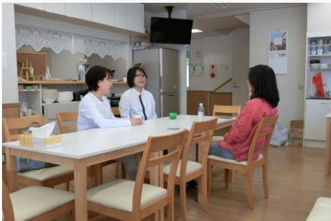
식당 ※ 개조 중