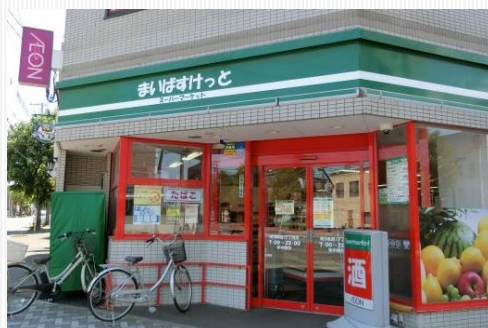
近隣スーパー(徒歩1分)